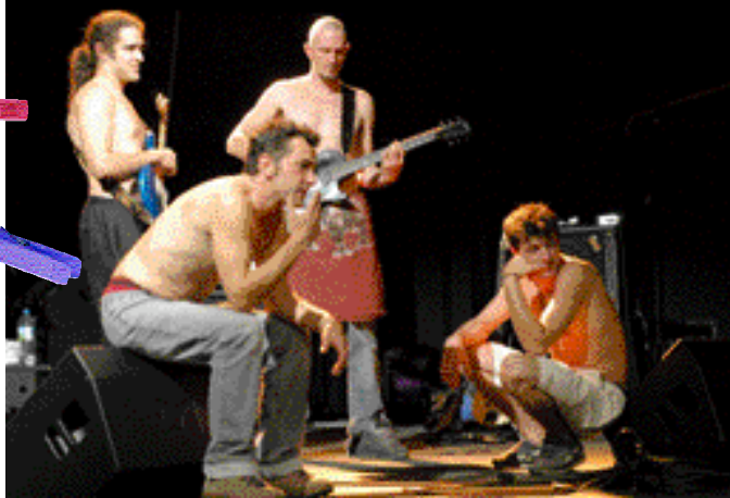
Tasmaniac , lauréat C'est ma tournée 2001 !

Le comité, composé des représentants des structures partenaires et des intervenants, retiendra 2 groupes.