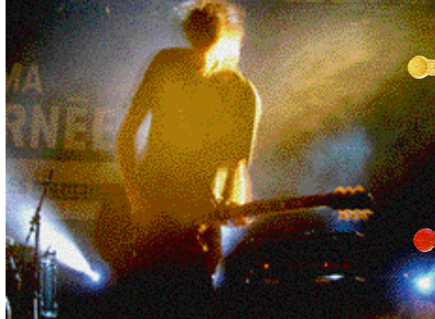
No Vice , lauréat C'est ma tournée 2004 !