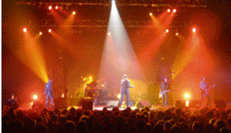
Hide Park Corner , lauréat C'est ma tournée 2005 !