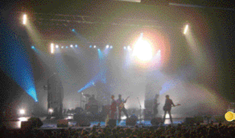
Hide Park Comer , lauréat C'est ma tournée 2005 !