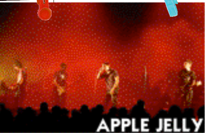
Apple Jelly , lauréat C'est ma tournée 2002 !

Participation, non rémunérée, des groupes lauréats à plusieurs concerts dans le département de l'Isère et en région Rhône-Alpes, grâce à l'implication des partenaires de la diffusion. Principe d'échange et de mise en réseau des groupes et des diffuseurs.